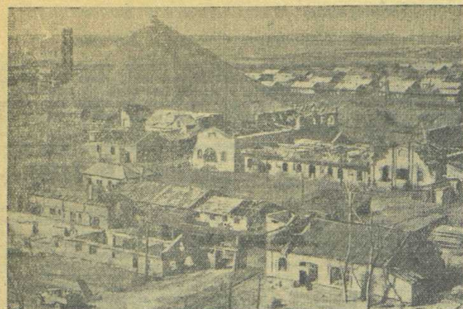
В ОСВОБОЖДЕННОМ ДОНБАССЕ: 1. Разрушенный гитлеровцами шахтёрский посёлок.